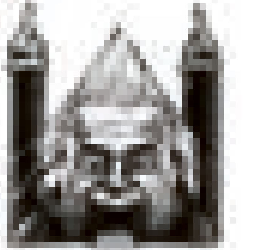
De winnende tekening verscheen twee dagen na PVV-winst. ILLUSTRATIE HAJO

In de jaren voor de pandemie liepen de museumbezoekcijfers op tot 32,6 miljoen in recordjaar 2019. Die trend zakte in door de sluitingen en restricties tijdens de coronapandemie. Het dieptepunt kwam in 2021, met 11,8 miljoen bezoeken. Dat liep vervolgens op tot 23,5 miljoen bezoeken in 2022, en in 2023 lijkt de