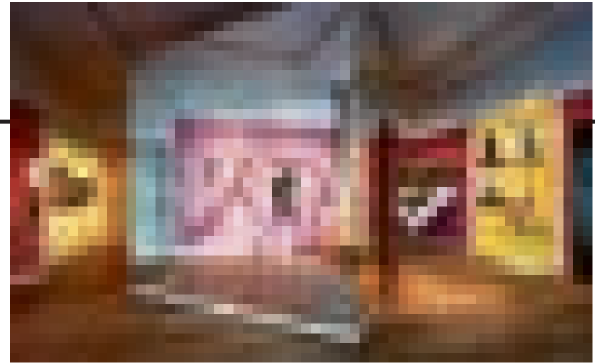
Vaste opstelling Museum van de Geest.

Ten onrechte, blijkt uit de forse kritiek die de Verenigde Naties deze maand uitte in een rapport. De VN stellen dat de Nederlandse overheid te weinig doet om afspraken uit het VN-mensenrechtenverdrag Handicap na te komen. „Hoe het in de kunst gaat, staat symbool voor hoe het in de maatschappij gaat”, zegt Hoek.