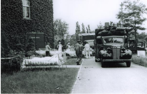
Evacuatie Duin en Bosch naar Coudewater Rosmalen, juni 1942.

In opdracht van de Stichting Vergeten Slachtoffers is het NIOD, Instituut voor Oorlogs-, Holocaust- en Genocidestudies, op 14 maart 2019 gestart met het onderzoek naar instellingen voor psychiatrische