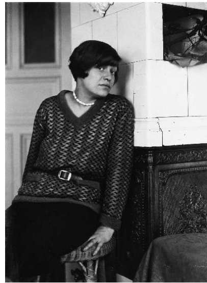
De werken van kunstenaar Elfriede Lohse-Wächtler hebben een avant-gardistische stijl. In 1940 wordt Elfriede geclassificeerd als 'onvolwaardig persoon'. Later wordt ze gedeporteerd en vermoord.