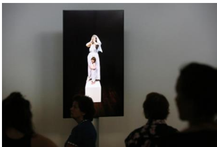
Fragment van de video-installatie 'Untitled'

Als bezoeker kun je op een aantal plekken de tijd nemen bij persoonlijke verhalen van mensen in de oorlog. Daarvoor staan in de tentoonstelling bijzondere stoelen 'met de ziel van de maker', gemaakt in de houtwerkplaats van Cordaan. Met de spelers van Theater LeBelle van Cordaan en de Toneelmakerij maakt theatermaker Eva Knibbe de video-installatie 'Untitled', inclusief live optredens. Untitled blikt vooruit op een tijd waarin mensen met het syndroom van Down alleen nog in een museum te zien zijn. Hoe kijk je naar mensen met een verstandelijke beperking? Van halfgod tot duivelskind, clown, knuffelbeer of creatief genie. Woorden bepalen hoe je kijkt én wat je ziet. 'Ik knuffel jou dwars door de tijd heen', zegt toneelspeler Esrah van Rooij wanneer ze tijdens de repetities hoort hoe mensen met een beperking vroeger werden behandeld.