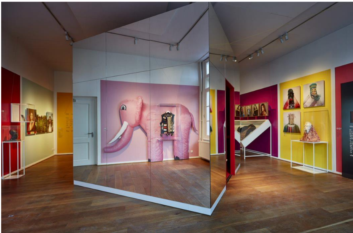
Beeld 3: Vaste opstelling Museum van de Geest

Het Museum van de Geest is gefascineerd door het kunstwerk tussen je oren. Want niets is zo kleurrijk, krachtig en tegelijkertijd zo kwetsbaar als de menselijke geest. Met kunst en cultuurprogramma's maken zij mentale gezondheid bespreekbaar in en buiten het museum. Het museum ontving in 2022 de prestigieuze European Museum of the Year award voor haar innovatieve en mensgerichte cultuuraanbod.