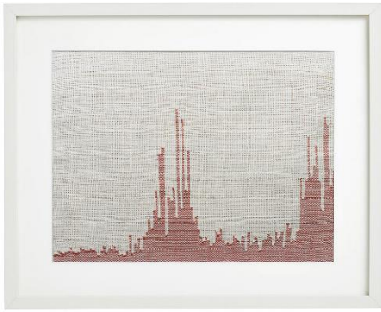
Beeld 2 - Doerte Weber, San Antonio Stats - Serie Covid Moments, 2020