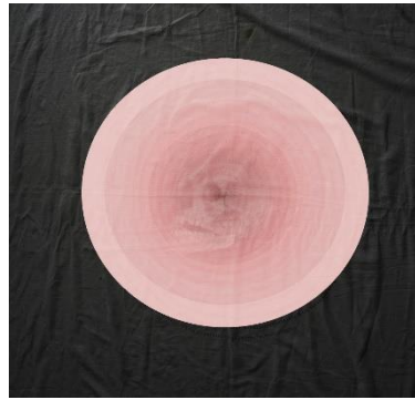
Beeld 3 - Eiko Ishizawa, "Fear For Numbers", print on paper, 2015